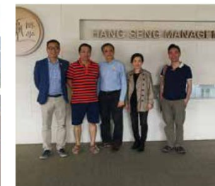
校友們難得重回母校，不忘參觀母校最新的設施。