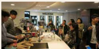
校友與同學們即席品嚐咖啡。