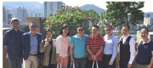
校友們欣賞環境清幽的賽馬會住宿書院天台花園。