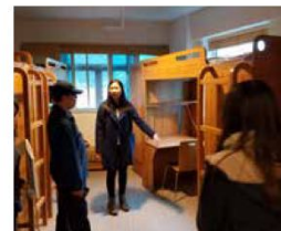
學生大使帶領校友參觀住宿書院。

校友會於未來日子將繼續加強與各校友的聯繫，有效地推動會務發展，凝聚校友力量，積極回饋母校，與恒管並肩成長。會後，學生大使帶領校友參觀賽馬會住宿書院，了解學生的住宿生活，加深恒管校園發展的認識。