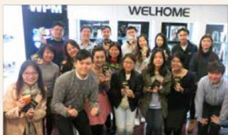
「品味咖啡工作坊」吸引一班熱愛咖啡的校友及學生參加。