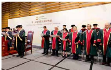
恒生管理學院舉辦第一屆榮譽院士頒授典禮。