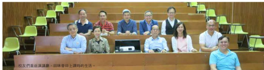
校友們重返演講廳，回味昔日上課時的生活。

此外，校友們難得聚首一堂，大家於席間逐一分享當年的校園趣事，以及互訴近況。為了向一眾闊別校園多年的校友介紹母校的發展，特別安排了校園導賞，由學生大使帶領他們遊覽校園設施，參觀舊有的課室及演講廳，並前往新建成的何善衡教學大樓、利國偉教學大樓及恒管廣場等參觀，加深對恒管新校園的認識。校友們齊聲感謝母校的款待，讓他們能一睹母校最新的發展。