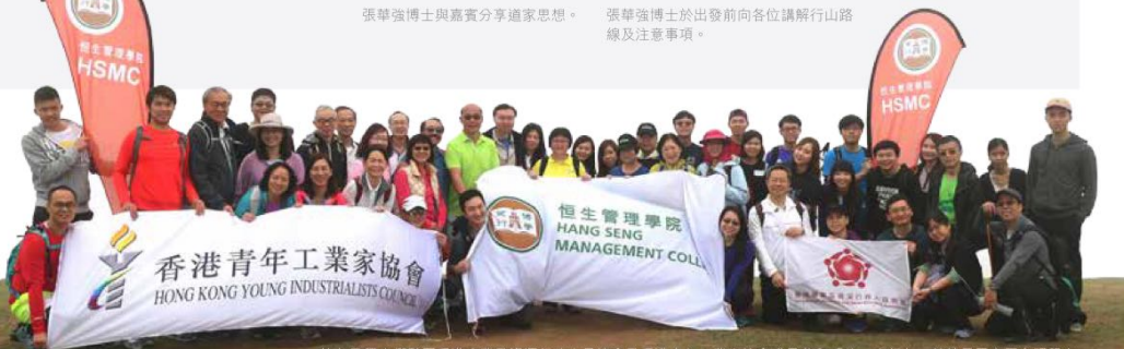
校友及學生們夥同香港專業及資深行政人員協會及香港青年工業家協會成員參與「悠·山行」，並於昂平高原合照留念。