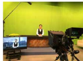
校友們參觀電視錄影廠。