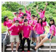
冰冰讀書時候非常活躍，參加很多課外活動。

五位來自不同中學的女生，不約而同因為恒管校譽好，渴望讀工商管理課程，以便日後在商界或金融界發展而入讀恒管成為同學。其後，大家又在偶然機會下互相牽引加入保險公司由Bing創立的Majesty團隊工作，這個團隊名字更是由恒管老師幫她們選的，蠻有意思。她們由同學成為同事，一起奮鬥，在工作中互相扶持、勉勵，齊齊拍住上。