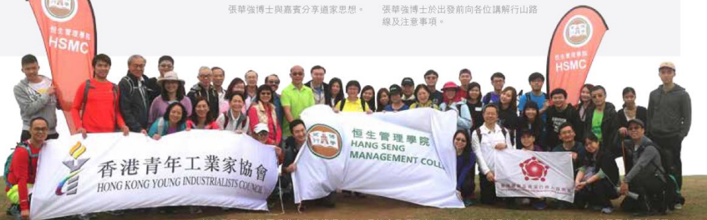
校友及學生們夥同香港專業及資深行政人員協會及香港青年工業家協會成員參與「悠·山行」，並於昂平高原合照留念。