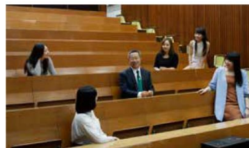
張江亭勉勵小師妹要向自己的目標前進，才能達成夢想。

小師妹： 你認為現在的恒管學生與你當時的同學比較，二者在職場上的表現有甚麼分別？