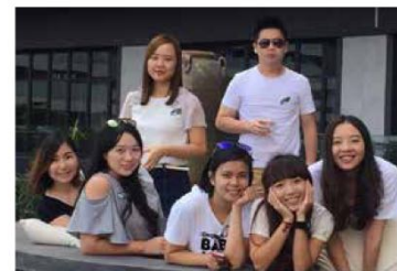
幾位小師妹由同學變為同事，感情深厚。