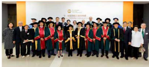
榮譽院士與主禮團、校董會成員及校務委員會成員合照。