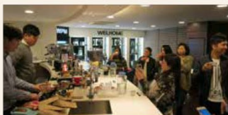
校友與同學們即席品嚐咖啡。