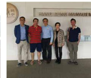
校友們難得重回母校，不忘參觀母校最新的設施。