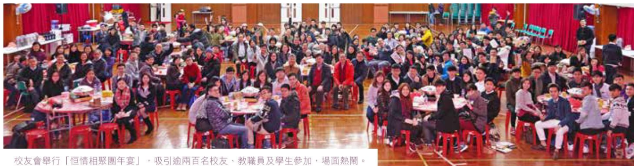
校友會舉行「恒情相聚團年宴」，吸引逾兩百名校友、教職員及學生參加，場面熱鬧。

晚宴節目豐富，校友會邀請了校友及學生表演歌舞助興，台下賓客反應熱烈，掌聲不絕。此外，當晚更獲何校長及數位熱心校友贊助大抽獎禮品，海天堂有限公司及泛亞飲食贊助贈券，令各位賓客滿載而歸，歡度溫馨難忘的晚上。